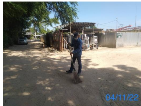
รูปที่ 3-36 การทำความสะอาดถนนบริเวณด้านหน้าทางเข้า-ออก ที่พักคนงาน

รูปที่ 3.1 ภาพถ่ายประกอบผลการปฏิบัติตามมาตรการป้องกันและแก้ไขผลกระทบสิ่งแวดล้อม โครงการโรงไฟฟ้าพลังความร้อนร่วม แห่งที่ 2 (ระยะก่อสร้าง) บริษัท บางกอกโคเจนเนอเรชั่น จำกัด