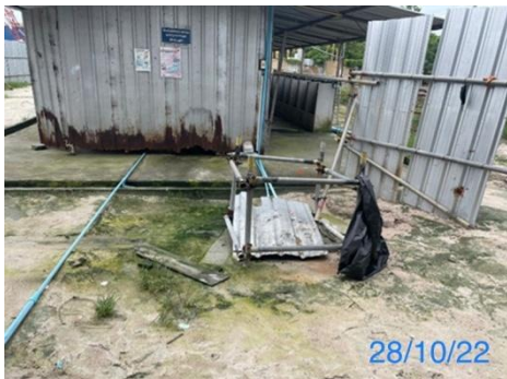
รูปที่ 3-33 ระบบบำบัดน้ำเสียขั้นต้น