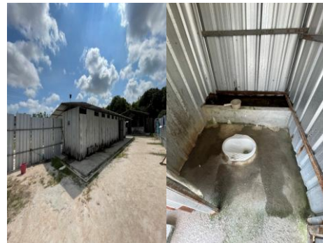
รูปที่ 3-32 ห้องน้ำ-ห้องส้วมภายในที่พักคนงาน