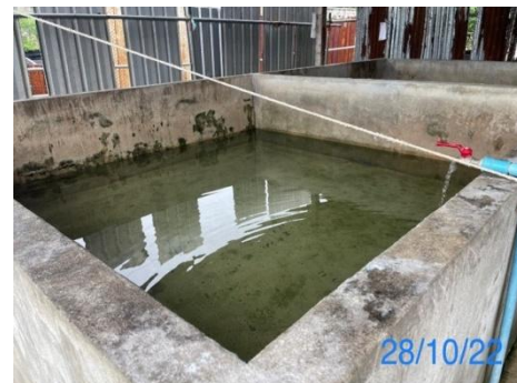
รูปที่ 3-30 น้ำสะอาดสำหรับ การอุปโภค-บริโภคภายในที่พักคนงาน

รูปที่ 3.1 ภาพถ่ายประกอบผลการปฏิบัติตามมาตรการป้องกัน และแก้ไขผลกระทบสิ่งแวดล้อม โครงการโรงไฟฟ้าพลังความร้อนร่วม แห่งที่ 2 (ระยะก่อสร้าง) บริษัท บางกอกโคเจนเออร์ชั่น จำกัด