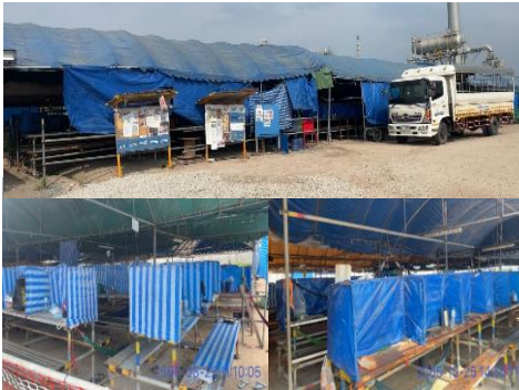
รูปที่ 3-19 ที่พักคนงานก่อสร้าง