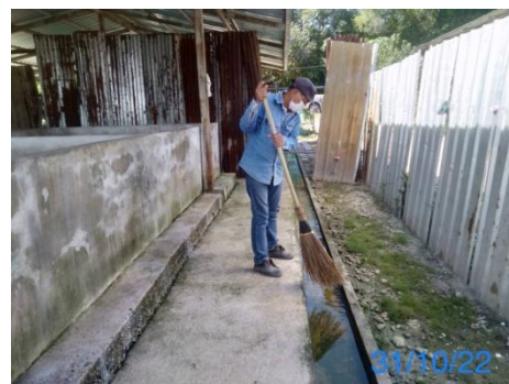
รูปที่ 3-42 การทำความสะอาดรางระบายน้ำ บริเวณที่พักคนงาน

รูปที่ 3.1 ภาพถ่ายประกอบผลการปฏิบัติตามมาตรการป้องกัน และแก้ไขผลกระทบสิ่งแวดล้อม โครงการโรงไฟฟ้าพลังความร้อนร่วม แห่งที่ 2 (ระยะก่อสร้าง) บริษัท บางกอกโคเจนเนอเรชั่น จำกัด