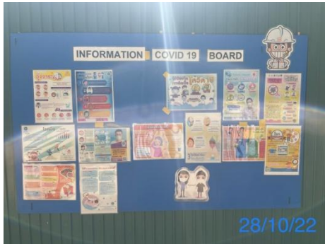
รูปที่ 3-37 ป้ายประชาสัมพันธ์ บริเวณที่พักคนงาน