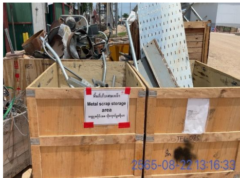
รูปที่ 3-15 พื้นที่จัดเก็บเศษวัสดุจากการก่อสร้าง