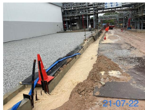
รูปที่ 3-6 รางระบายน้ำชั่วคราว

รูปที่ 3.1 ภาพถ่ายประกอบผลการปฏิบัติตามมาตรการป้องกัน และแก้ไขผลกระทบสิ่งแวดล้อม โครงการโรงไฟฟ้าพลังความร้อนร่วม แห่งที่ 2 (ระยะก่อสร้าง) บริษัท บางกอกโคเจนเนอเรชั่น จำกัด