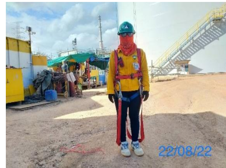
รูปที่ 3-26 พนักงานสวมใส่อุปกรณ์ คุ้มครองความปลอดภัยส่วนบุคคล