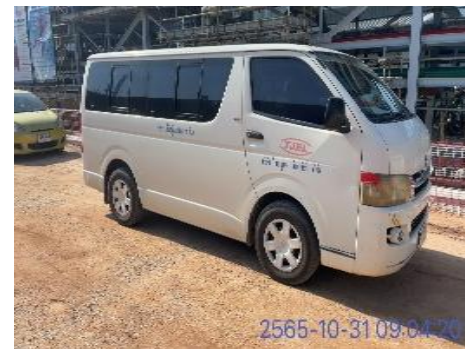
รูปที่ 3-28 รถยนต์ใช้ในกรณีฉุกเฉิน