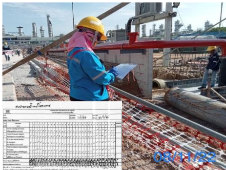
รูปที่ 3-11 เจ้าหน้าที่ตรวจสอบรางระบายน้ำ