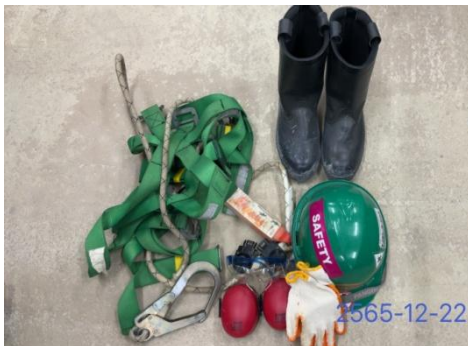
รูปที่ 3-21 อุปกรณ์คุ้มครองความปลอดภัยบุคคล