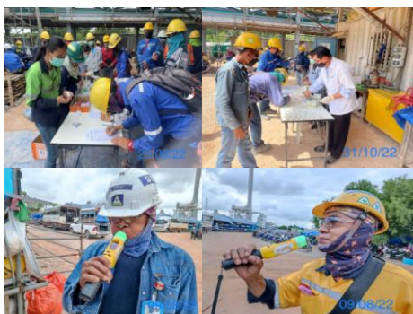
รูปที่ 3-39 การสุ่มตรวจแอลกอฮอล์ และสารเสพติด