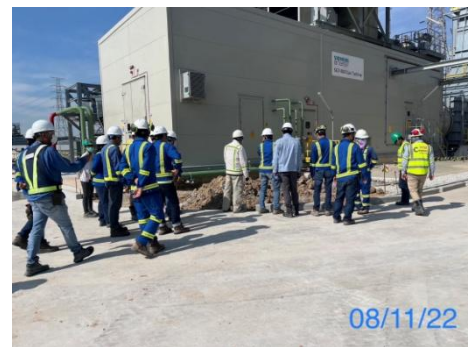
รูปที่ 3-24 เจ้าหน้าที่ตรวจสอบความปลอดภัยในการทำงาน

รูปที่ 3.1 ภาพถ่ายประกอบผลการปฏิบัติตามมาตรการป้องกันและแก้ไขผลกระทบสิ่งแวดล้อม โครงการโรงไฟฟ้าพลังความร้อนร่วม แห่งที่ 2 (ระยะก่อสร้าง) บริษัท บางกอกโคเจนเนอเรชั่น จำกัด