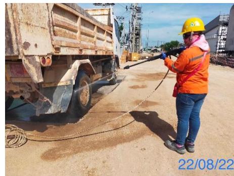
รูปที่ 3-4 เจ้าหน้าที่ทำความสะอาดตัวรถ และล้อรถบรรทุกก่อนออกจากพื้นที่ก่อสร้าง