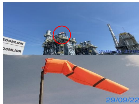
รูปที่ 3-2 ดูกมบริเวณพื้นที่ก่อสร้าง