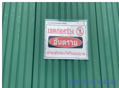
รูปที่ 3-17 ป้ายแสดงเขตพื้นที่ก่อสร้าง