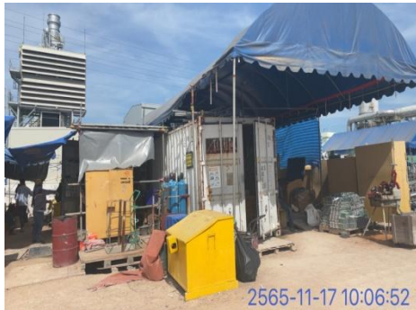
รูปที่ 3-13 พื้นที่จัดเก็บวัสดุ อุปกรณ์ เครื่องมือการก่อสร้าง