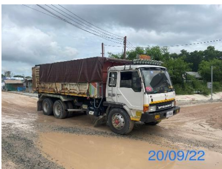
รูปที่ 3-3 การปิดคลุมรถบรรทุก ขนส่งวัสดุก่อสร้าง