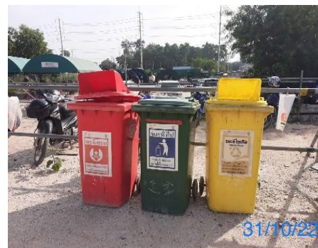
รูปที่ 3-12 ถังรองรับขยะมูลฝอย

รูปที่ 3.1 ภาพถ่ายประกอบผลการปฏิบัติตามมาตรการป้องกันและแก้ไขผลกระทบสิ่งแวดล้อม โครงการโรงไฟฟ้าพลังความร้อนร่วม แห่งที่ 2 (ระยะก่อสร้าง) บริษัท บางกอกโคเจนเออร์ชั่น จำกัด