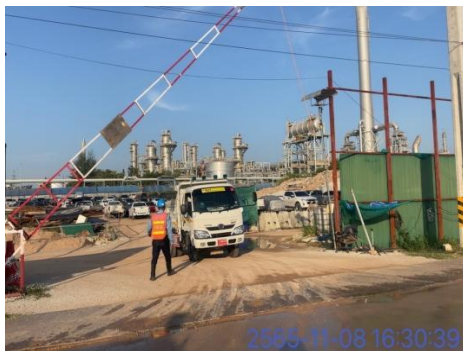
รูปที่ 3-9 เจ้าหน้าที่อำนวยความสะดวกและดูแลการเข้า-ออกบริเวณพื้นที่ก่อสร้าง