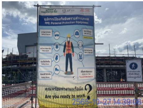
รูปที่ 3-25 ป้ายเตือนให้สวมใส่อุปกรณ์ คุ้มครองความปลอดภัยส่วนบุคคล