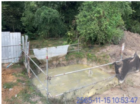
รูปที่ 3-7 บ่อดักตะกอน