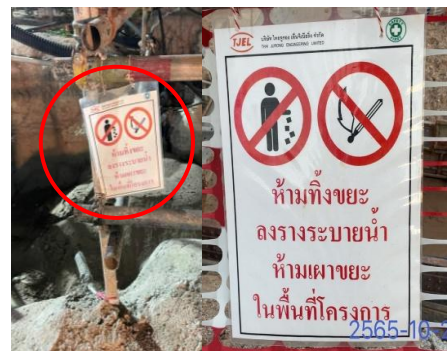
รูปที่ 3-10 ป้ายเตือนห้ามทิ้งขยะมูลฝอยลงรางระบายน้ำ