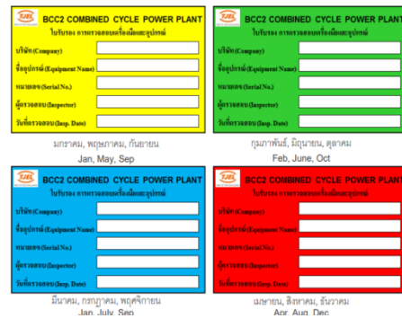
รูปที่ 3-8 สติกเกอร์แสดงการตรวจสอบ