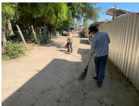
รูปที่ 3-41 กิจกรรม House Keeping