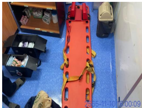
รูปที่ 3-27 อุปกรณ์ปฐมพยาบาลเบื้องต้น