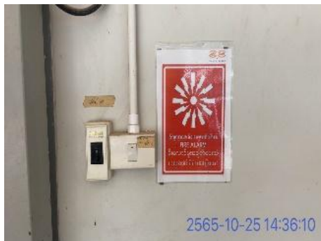
รูปที่ 3-29 ระบบสัญญาณเตือนภัย