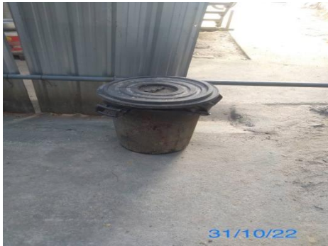
รูปที่ 3-31 ภาพของถังขยะที่วางอยู่บนพื้นคอนกรีตในบริเวณที่พักคนงาน