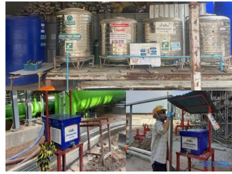
รูปที่ 3-20 น้ำสะอาดสำหรับการอุปโภค-บริโภค