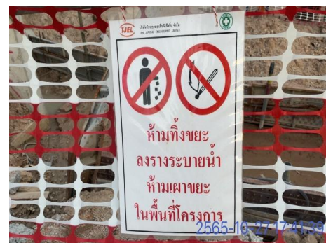
รูปที่ 3-16 ป้ายเตือนห้ามเผาขยะ