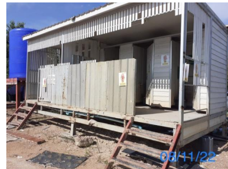
รูปที่ 3-22 ห้องสุขาสำหรับคนงานก่อสร้าง