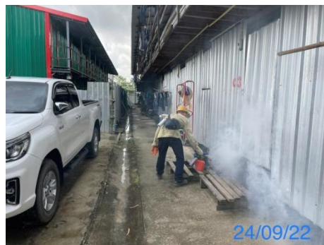
รูปที่ 3-44 การพ่นยากำจัดยุง บริเวณที่พักคนงานก่อสร้าง

รูปที่ 3.1 ภาพถ่ายประกอบผลการปฏิบัติตามมาตรการป้องกัน และแก้ไขผลกระทบสิ่งแวดล้อม โครงการโรงไฟฟ้าพลังความร้อนร่วม แห่งที่ 2 (ระยะก่อสร้าง) บริษัท บางกอกโคเจนเนอเรชั่น จำกัด