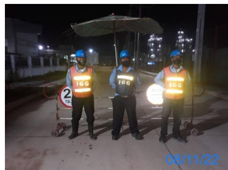
รูปที่ 3-18 เจ้าหน้าที่รักษาความปลอดภัย ตลอด 24 ชั่วโมง

รูปที่ 3.1 ภาพถ่ายประกอบผลการปฏิบัติตามมาตรการป้องกัน และแก้ไขผลกระทบสิ่งแวดล้อม โครงการโรงไฟฟ้าพลังความร้อนร่วม แห่งที่ 2 (ระยะก่อสร้าง) บริษัท บางกอกโคเจนเนอเรชั่น จำกัด