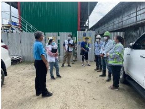
รูปที่ 3-43 หน่วยงานสาธารณสุขตรวจเยี่ยม ที่พักคนงานก่อสร้าง