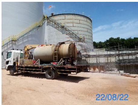
รูปที่ 3-1 การฉีดพรมน้ำบริเวณพื้นที่ก่อสร้าง