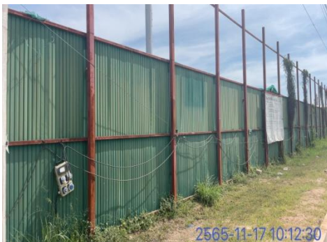
รูปที่ 3-23 ขอบเขตและแนวรั้วบริเวณพื้นที่ก่อสร้าง