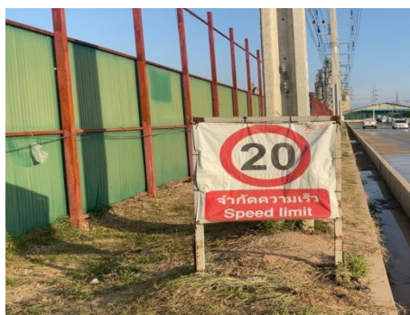
รูปที่ 3-5 ป้ายจำกัดความเร็ว