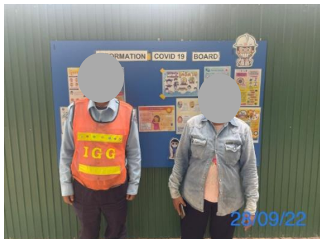
รูปที่ 3-35 เจ้าหน้าที่อำนวยความสะดวกบริเวณที่พักคนงาน