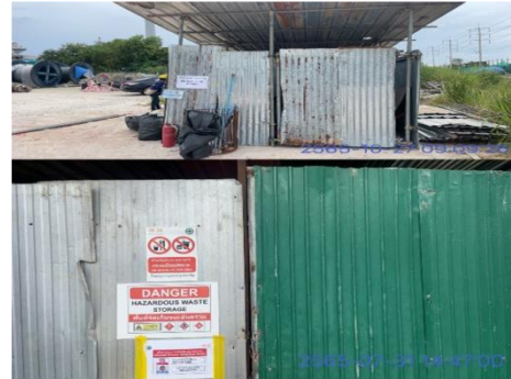
รูปที่ 3-14 พื้นที่จัดเก็บขยะมูลฝอย