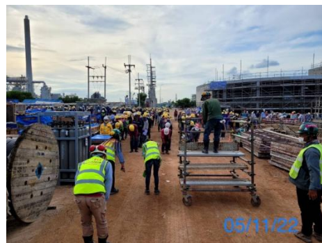
รูปที่ 3-40 Tool Box Talk Meeting