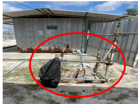
รูปที่ 3-34 ระบบบำบัดน้ำเสียสำเร็จรูป